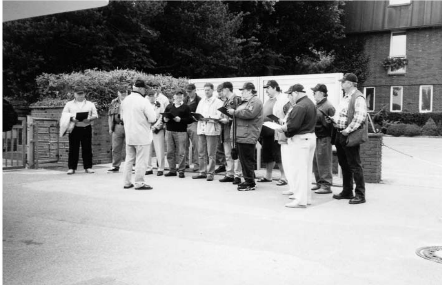
Ständchen am Marinedenkmal Laboe, 27. 6. 2003