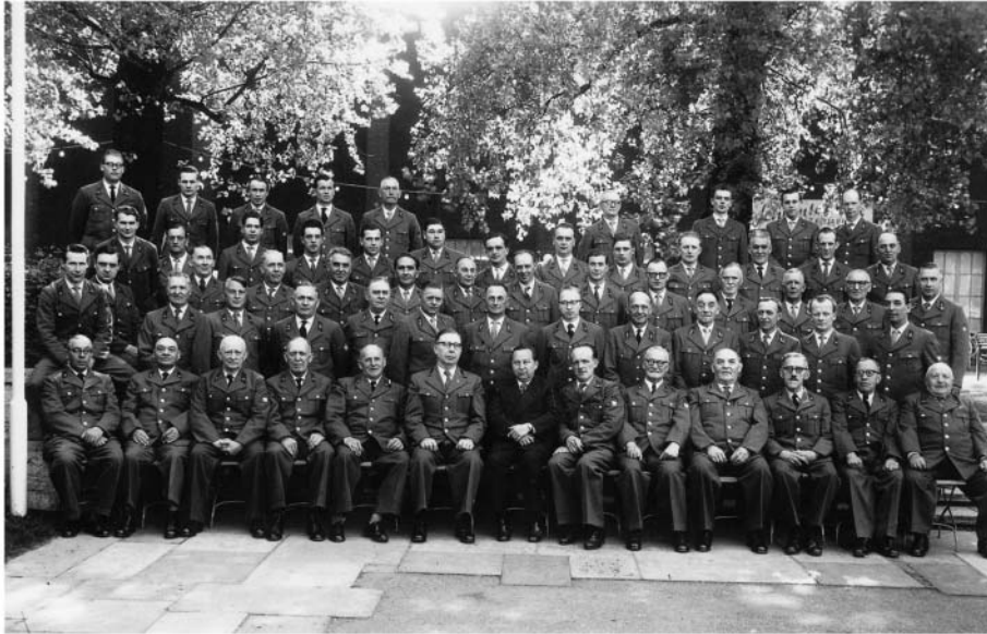
Gruppenfoto 1958 „Männerchor der Kölner Verkehrs-Betriebe AG 1908“