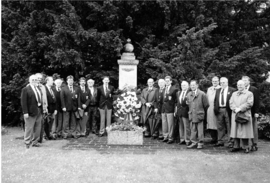
Kranzniederlegung am 12. Juni 1998 an der Gedenktafel für die Gefallenen im 1. Weltkrieg auf dem Westfriedhof in Köln-Braunsfeld