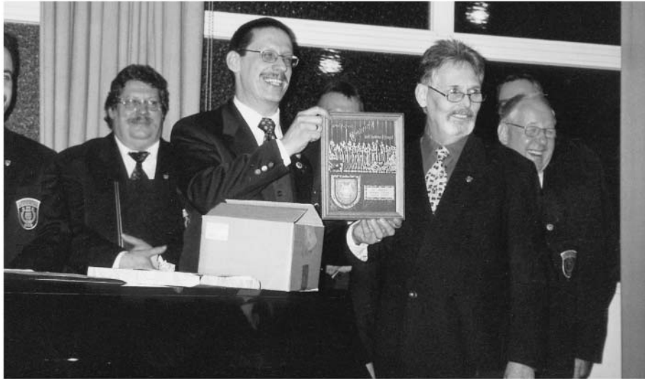
07. 04. 2000: Chortreffen in Düsseldorf anlässlich des 50-jährigen Bestehens des KIEPE Männerchores