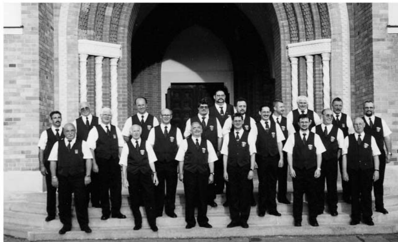
Gruppenfoto vor der St. Leopold Kirche im Donauefing bei Wien, am 24.06.2000