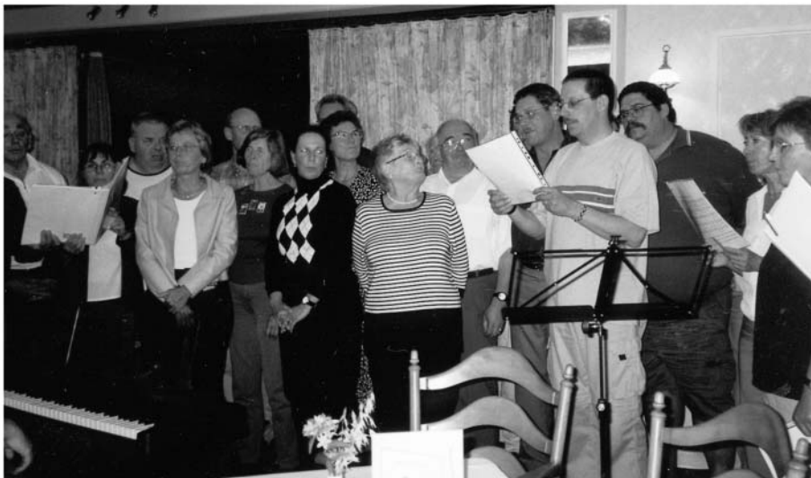
29. 06. 2002, die „Dersauer Dorfsänger“ und der Männerchor der KVB beim gemütlichen Abend im „Hotel zur Mühle am See“ in Dersau.